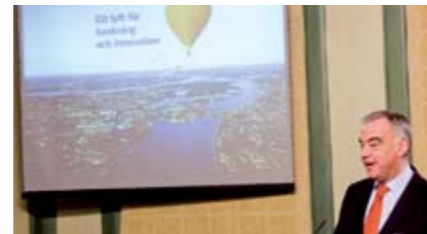
Lars Leijonborg presenterar forskningspropositionen den 23 oktober.

Betydelsen av genusforskning nämns kortfattat i kapitlet "Annan forskning med betydelse för samhälle och näringsliv". Forskningen motiveras i termer av