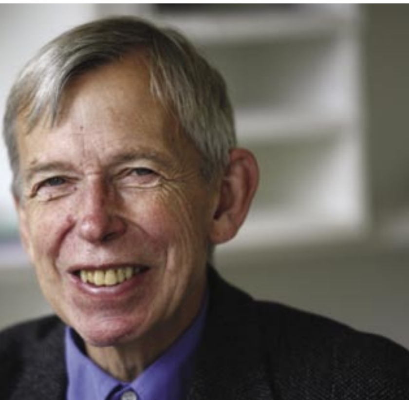
– Kvinnor får sina liv inskränkta av mäns våld mot kvinnor, anser Gunnar Ågren, som vill att regeringen ska inrätta ett nytt delmål i folkhälsopolitiken om frihet från könsrelaterat våld.