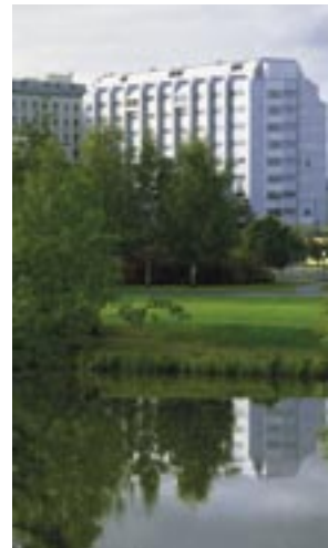
Det nya genuscentret i Umeå vill integrera genusperspektiv i forskning och undervisning vid medicinska fakulteten.

Den närmaste treårsperioden vill initiativtagarna starta ett nyhetsbrev och en webbplats, ett forskningssamarbete där gemensamma forskningsprojekt kan utvecklas, en diskussion om hur undervisningen om genus kan utvecklas samt utåtriktade temadagar.