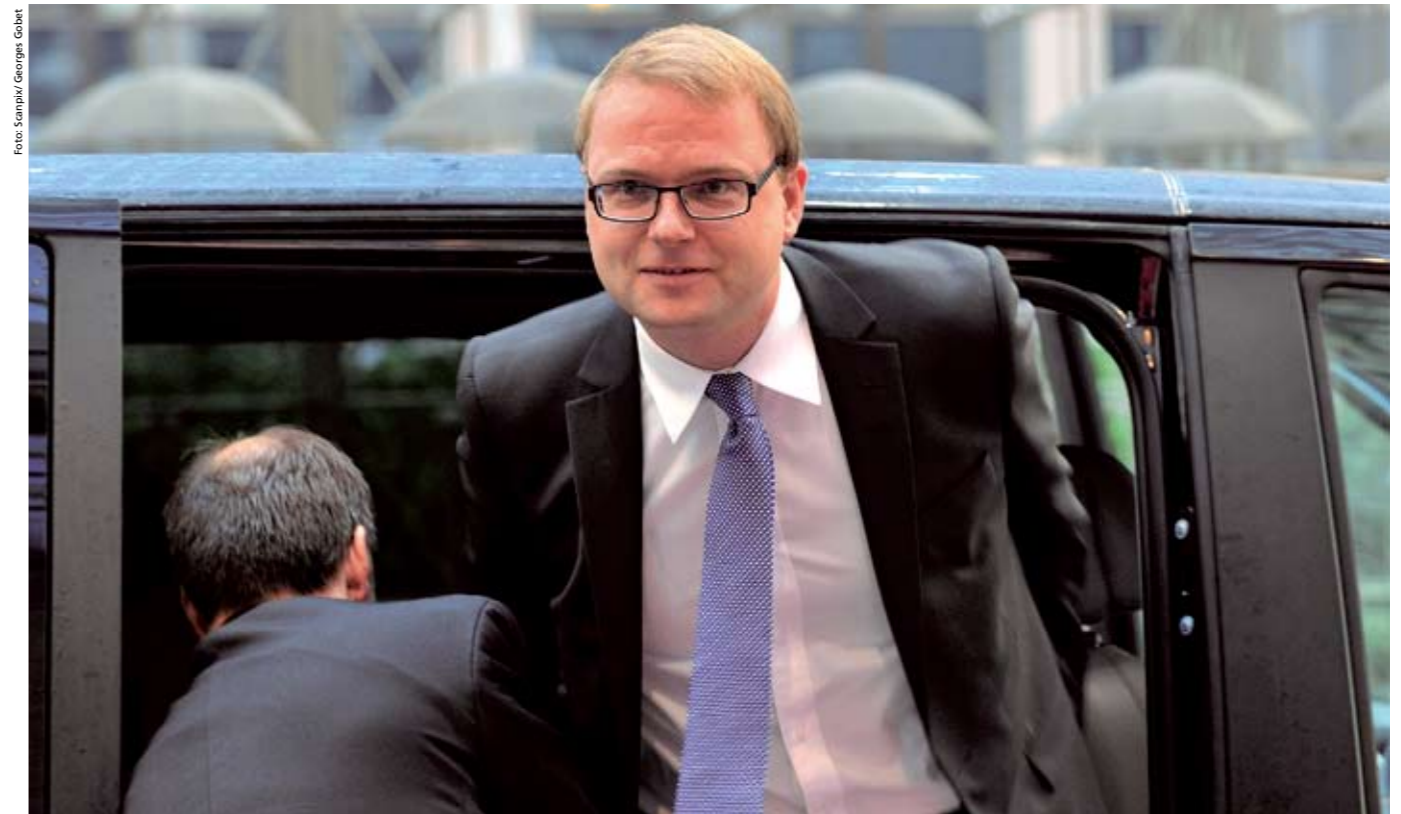
För forskningsminister Tobias Krantz är jämställdhet främst en rättighetsfråga, som handlar om att kvinnor och män ska ha samma möjligheter att forma samhället och sina egna liv. 2002 anmälde han Jönköpings läns landsting till Jämo och fick rätt på flera punkter.

att all forskning måste vara kortsiktigt nyttig, understryker ministern.