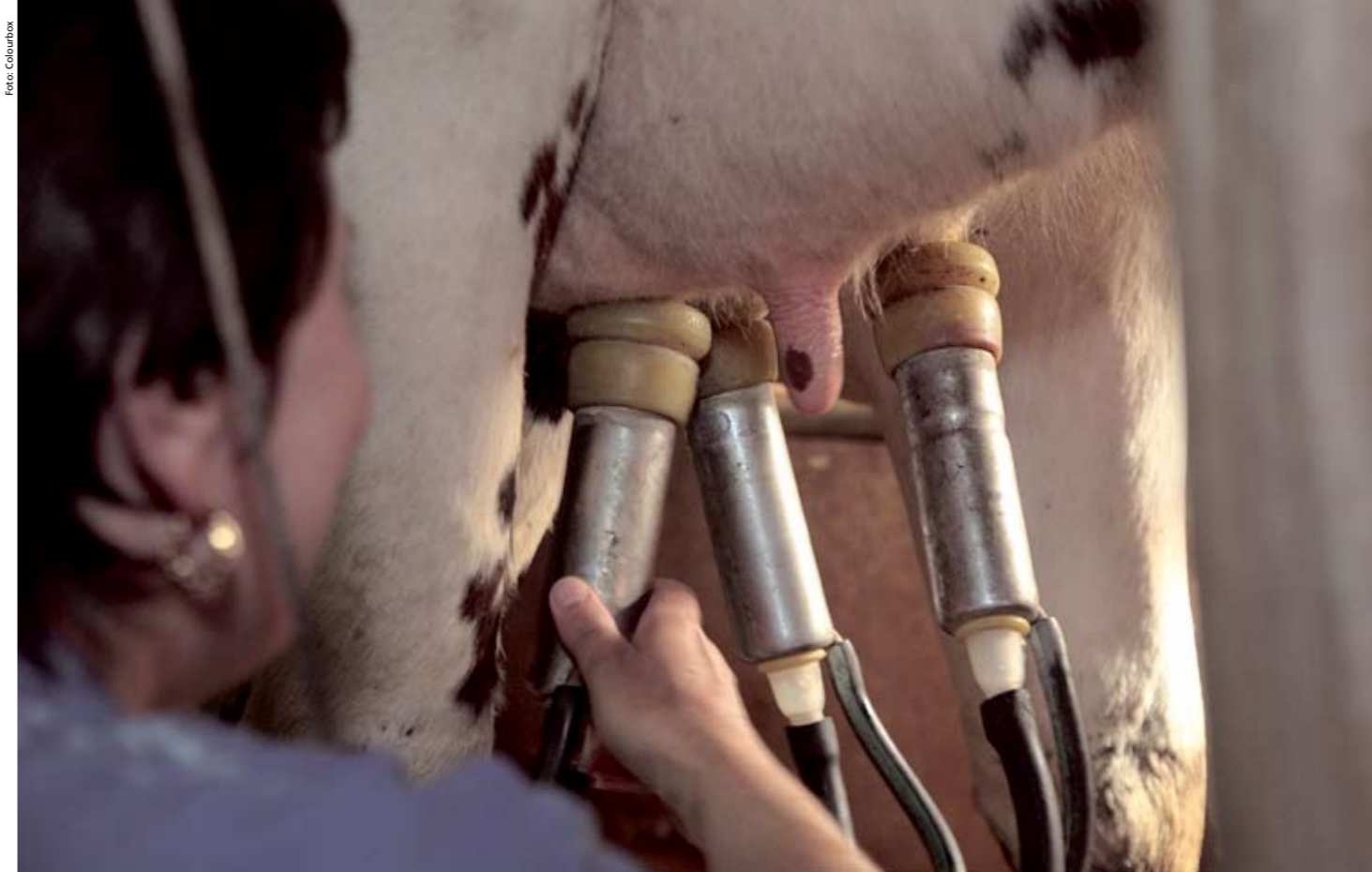
”Vi äger vår gård tillsammans min man och jag men jag syns liksom inte”, utropade en av kvinnorna som besökte LRF:s seminarier. Kvinnors osynlighet som företagare inom svenskt lantbruk kan få allvarliga följder för hennes sjukpenning, föräldrapenning och pension.

– Det kan vara så att företagsforskare inte har sett jordbruk som något entre-