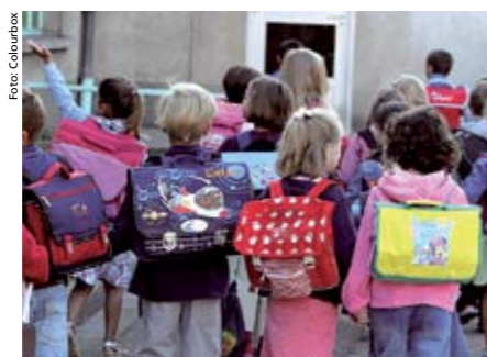
Genusmedvetenhet i skola och förskola var det vanligaste temat bland årets ”genusmotioner”.

De socialdemokratiska motionärerna tar även upp bristen på jämställdhet inom akademien, i professorskåren i syn-