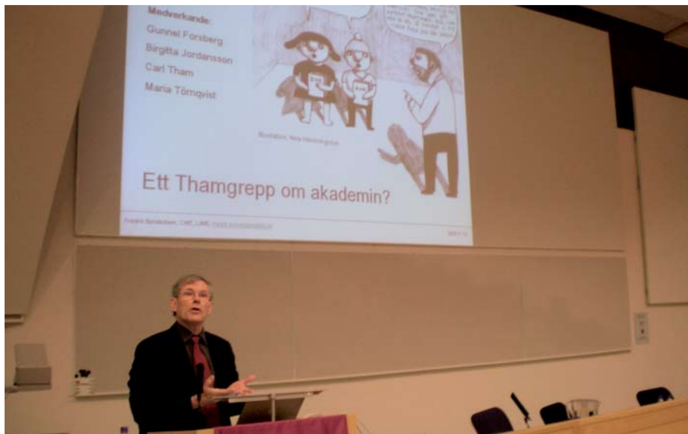
Man får inte vara för räddhågad om man vill åstadkomma förändring genom politiska beslut, sade föredetta utbildningsminister Carl Tham, som medverkade vid Karolinska institutets jämställdhetskonferens.