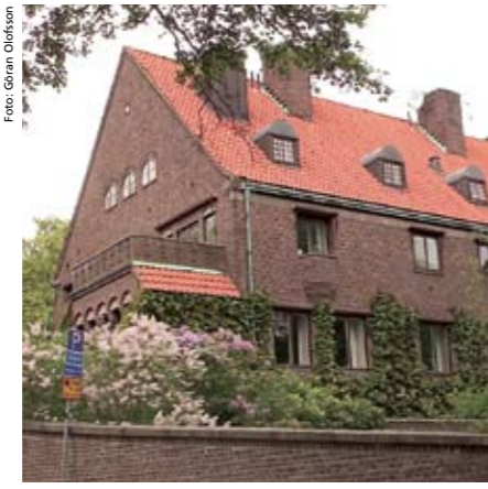
Organisatoriska förändringar väntar Nationella sekretariatet före genusforskning 2010.

styrts av en regeringsutsedd styrelse. Denna kommer i den nya organisationen att ersättas med ett insynsråd, där såväl olika områden inom genusforskningen som olika lärosäten finns representerade.