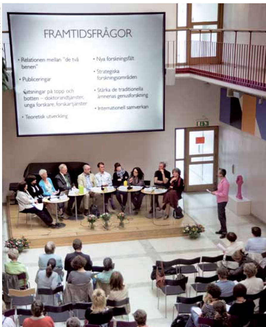
Genusforskningens synlighet och konkurrenskraft varierar stort mellan olika forskningsråd. Det framkom vid den hearing om genusforskning som hölls på KTH i början av sommaren.