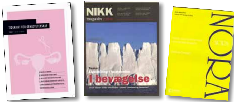
Tidskrift för genusvetenskap, Nikk magasin och Nora, Nordic Journal of Gender and Feminist research har kommit med sina sista nummer för 2010.