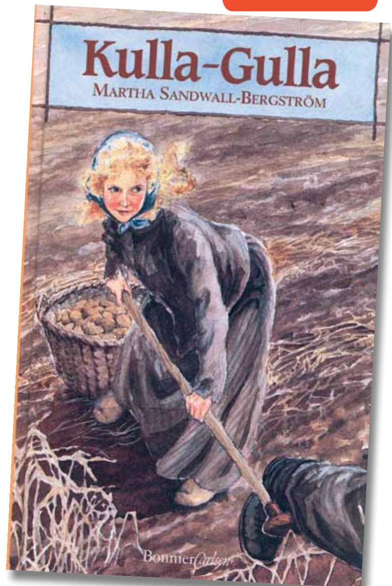
Kulla-Gullaböckerna orsakade stor debatt när de kom ut och står fortfarande som symbol för en föraktad kulturyttring. Trots det läses och älskas de än idag av många flickor. Här en utgåva från 2001.