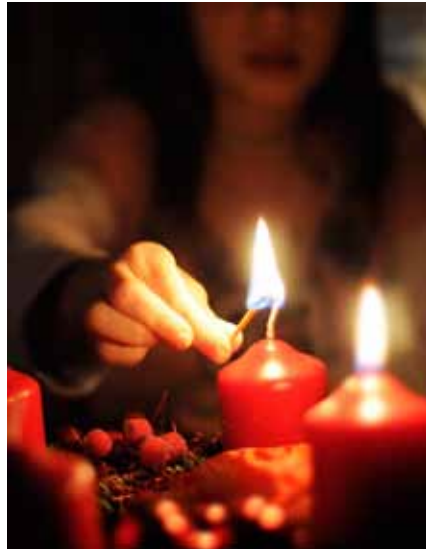
Ritualer och rituellt handlade ses framför allt som nya och alternativa vägar till religiösa upplevelser.

ceras som postmodern andlighet, new age eller nyhedendom. Studien grundar sig på flerårigt fältarbete av religiös praktik där kvinnor har huvudrollen och är främsta deltagare.