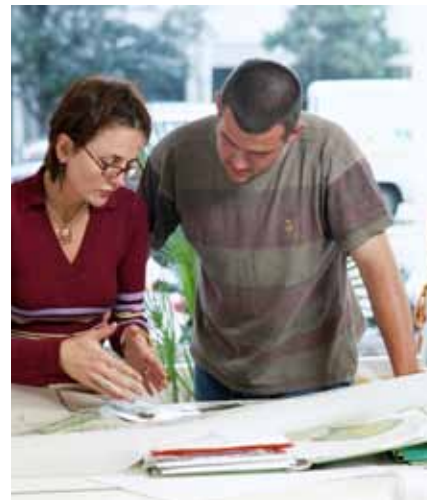
Jämställdhet framställs som en självklarhet men samtidigt finns vissa reservationer inför vad som kan vara jämställdhetens mål.

ningsvärld om marknaden som alldeles nödvändig och i en värld som domineras av män och manliga normer.