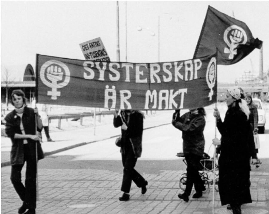
Sjuttioalets kvinnokamp har betytt mycket för att förändra kvinnors situation. I boken Tusen systrar ställde krav berättar ett fyrtiotal gamla aktivister om sitt engagemang

menckap, men också de som kände sig utanför och förnedrade. Vad är det som skapar dessa känslor och vilken roll spelar de i samhällslivet?