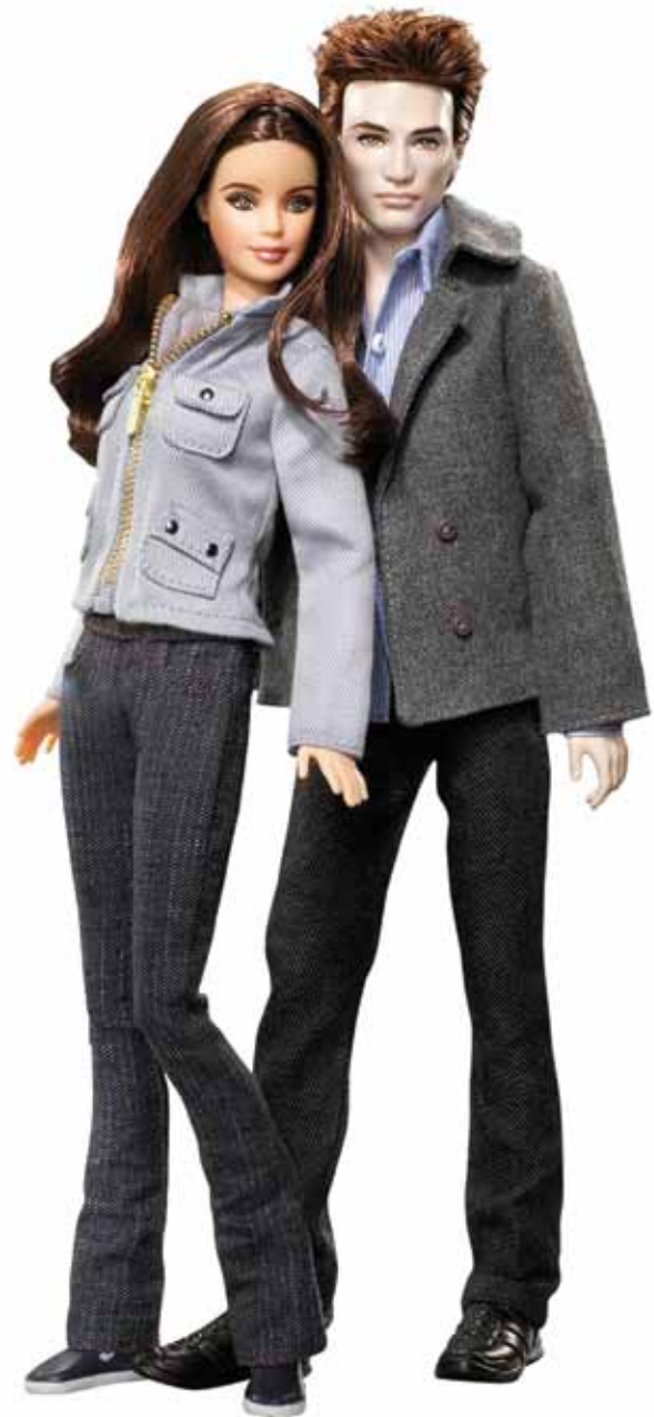
Vampyrer har fått ett enormt genomslag i populärkulturen. Huvudpersonerna i Twilightserien, Bella och vampyren Edward har till och med blivit Barbiedockor. Nu har de även blivit forskningsobjekt.