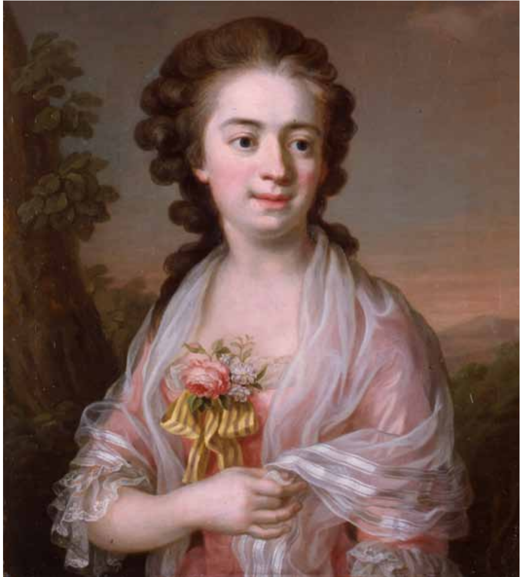
Självporträtt av Ulrica Fredrica Pasch, som 1773, som första kvinna, valdes in i den Svenska Konstakademien. Porträttet tillhör Konstakademien.

för kvinnor som inte fick tillträde till utbildningen för- rån 1864.