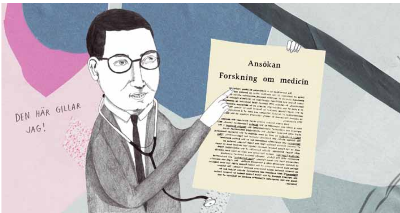
Enligt forskningen om kollegial bedömning är bedömare som mest benägna att se excellens i den forskning som är mest lik den han eller hon själv bedriver.